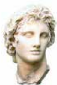
ALEXANDRE EL GRAN

Aquestes persones, homes i dones, han estat molt importants i influents en diferents moments de la història. Consulteu a internet o a les enciclopèdies de la biblioteca les dades més rellevants que heu trobat referents a cada personatge i col·loqueu-les a sota de les fotos següents.