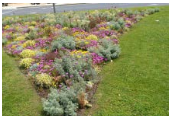
3. Avinguda de l'Estatut Plantació de grups de flor mixtes que duren més anys.