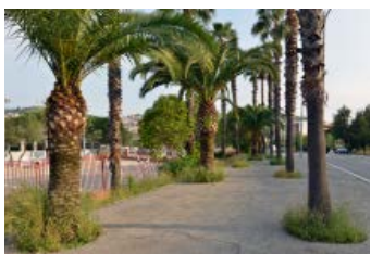
4. Avinguda Vidal i Barraquer Plantes espontànies als escocells.