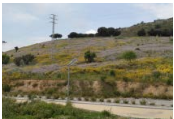
1. Camí de Cal Notari Herbassar.