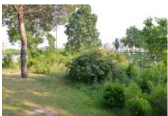
5. Passeig de la Vall d'Hebron Plantació d'arbusts d'interès per atraure fauna.