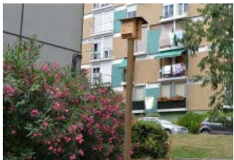
2. Carrer Benlliure Sembra d'un prat de flors d'interès per a la biodiversitat i instal·lació de torre niu de ratpenats.