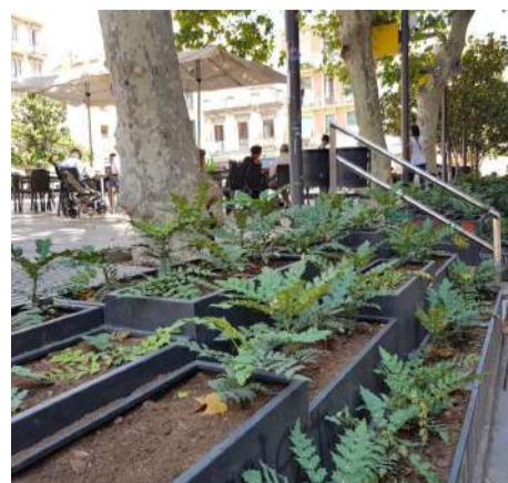
Jardineres a la pl. Sol

La instal·lació de jardineres a les escales de la banda del c. Maspons a l'estiu de 2017, així com l'avançament de les operacions de baldeig i de buidat de papereres, ha permès que es rebaixés substancialment les molèsties de soroll al veïnat. El reforç de la Guàrdia Urbana també ha contribuït a aquesta millora.