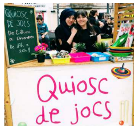
Quiosc de jocs a la pl. Sol