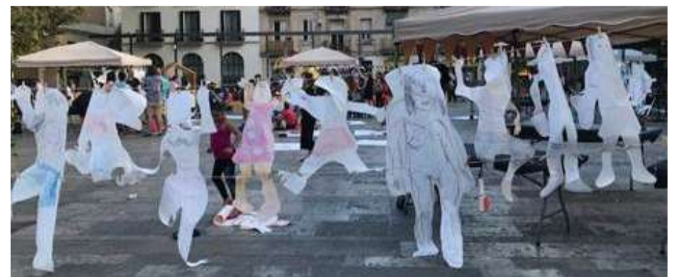
Intervencions artístiques a pl. Sol