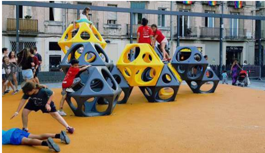
Àrea de jocs a pl. Sol

proposta que va plantejar el veïnat a través de la Taula Ciutadana de plaça del Sol. La instal·lació es va fer entre el 25 de juny i el 2 de juliol i ocupa una superfície de 75 m 2 a