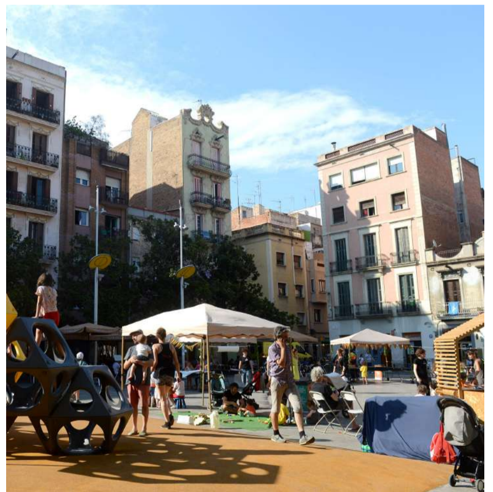
Quiosc de jocs a la pl. Sol

La taula tècnica i les taules ciutadanes es retroalimenten, cosa que ha permès impulsar diferents mesures i fer proves pilot que acaben implementant-se en funció dels resultats. És un bon exemple de la coproducció de polítiques públiques.