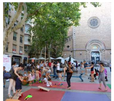
Taller de circ a la pl. Virreina