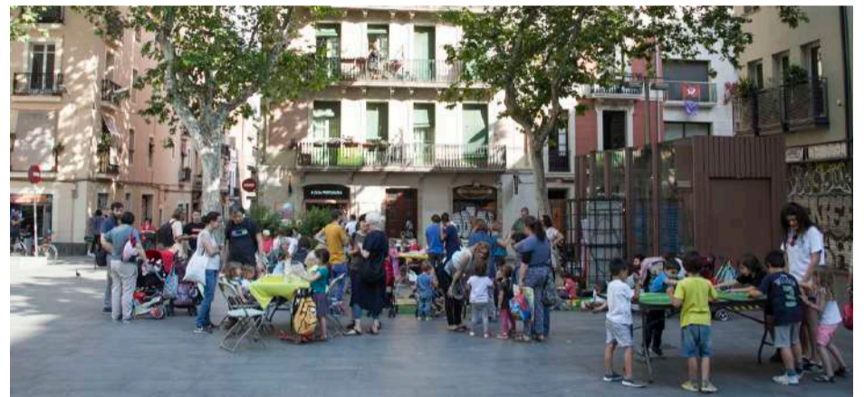
Jocs de taula a la pl. Diamant

Fins a finals de juliol i la primera setmana de setembre, es poden trobar propostes lúdiques a la plaça de la Revolució, la plaça del Diamant, la plaça de la Virreina i la plaça del Sol. Es tracta de que grans, petits i petites puguin gaudir de les places del barri com a lloc de trobada on aprendre a valorar i a millorar l'ús de l'espai públic. Hi ha jocs tradicionals per a infants, tallers creatius per a joves de totes les edats, activitats artístiques per fer en família...L'important és aprendre els valors del joc compartit i el respecte. En total, durant tot l'estiu, s'han programat 12 dies per fer tallers creatius a la pl. Revolució, 12 de tallers de circ a la pl. Virreina, 11 dies de jocs de taula a pl. Diamant, 6 dies d'intervencions artístiques a la pl. Sol i 81 dies per al quiosc de jocs de la pl. Sol.