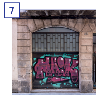
7 c. Carretes, 43 Superfície útil: 121,06 m 2 Estat: reforma prevista