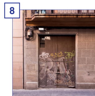
8 Santa Madrona, 6-8 (local 2) Superfície útil: 139,30 m 2 Estat: reforma prevista