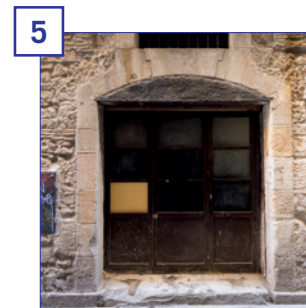
5 c. Flassaders, 23 Superfície útil: 35 m 2 Estat: reforma prevista Altres: entrada pel carrer de Sabateret