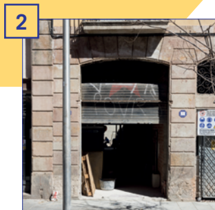
2 c. Robador, 43 Superfície útil: 68,90 m 2 Estat: finca en reformes Altres: local amb pati de 42,05 m 2