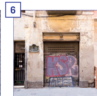
6 c. Cera, 10 Superfície útil: 35 m 2 Estat: reforma prevista