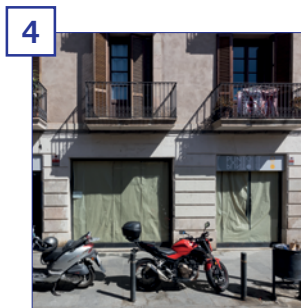
4 c. Francesc Cambó, 30-36 Superfície útil: 59 m 2 Estat: en reformes Altres: entrada pel carrer Giralt el Pellicer, davant del Mercat de Santa Caterina