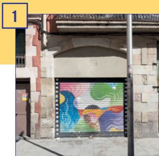
1 c. Robador, 21 Superfície útil: 111 m 2 Estat: en reformes