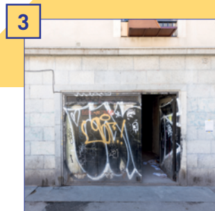
3 c. Arc del Teatre, 13 Superfície útil: 155 m 2 Estat: reforma prevista Altres: espai d'entrada diàfan i 3 sales independents