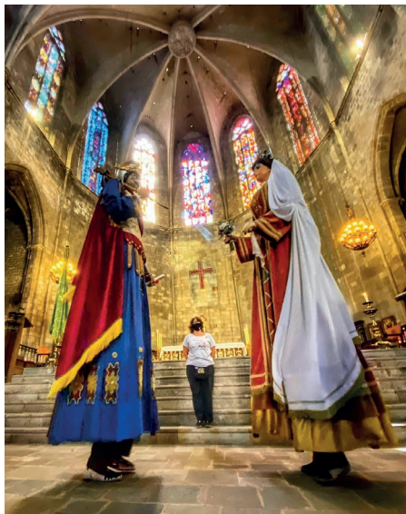
Autor: Albert Caelles @albertcaelles