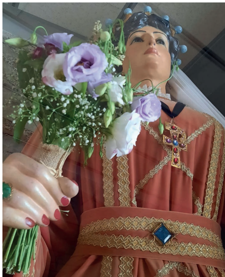
Autora: Esther Planas @ishtaplif