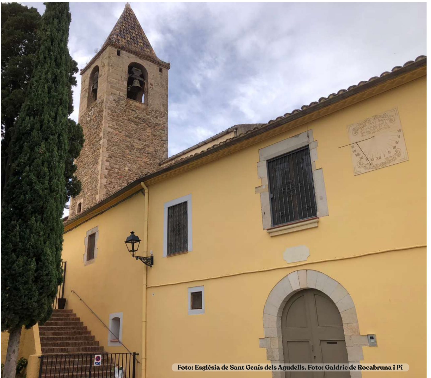
Foto: Església de Sant Genís dels Agudells.