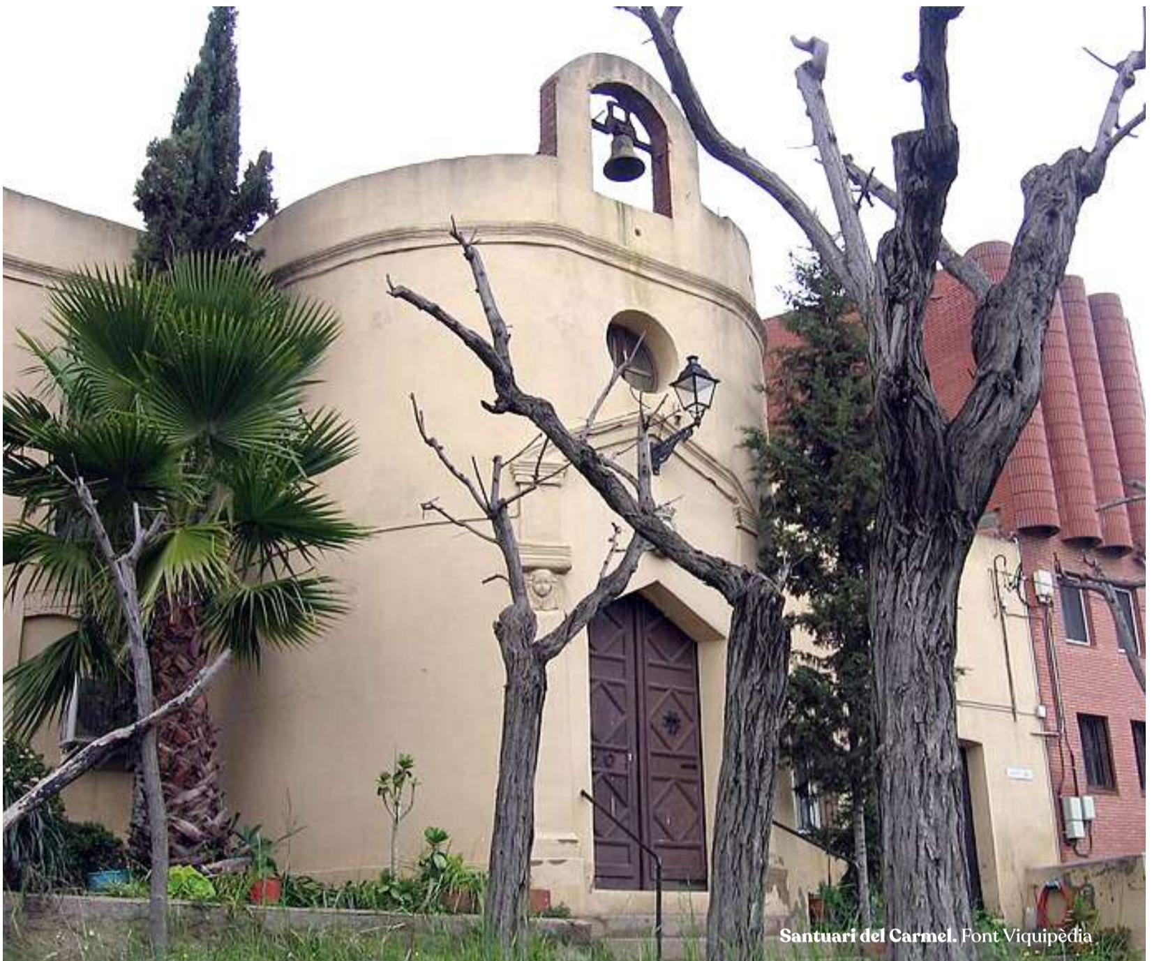
Santuari del Carmel.