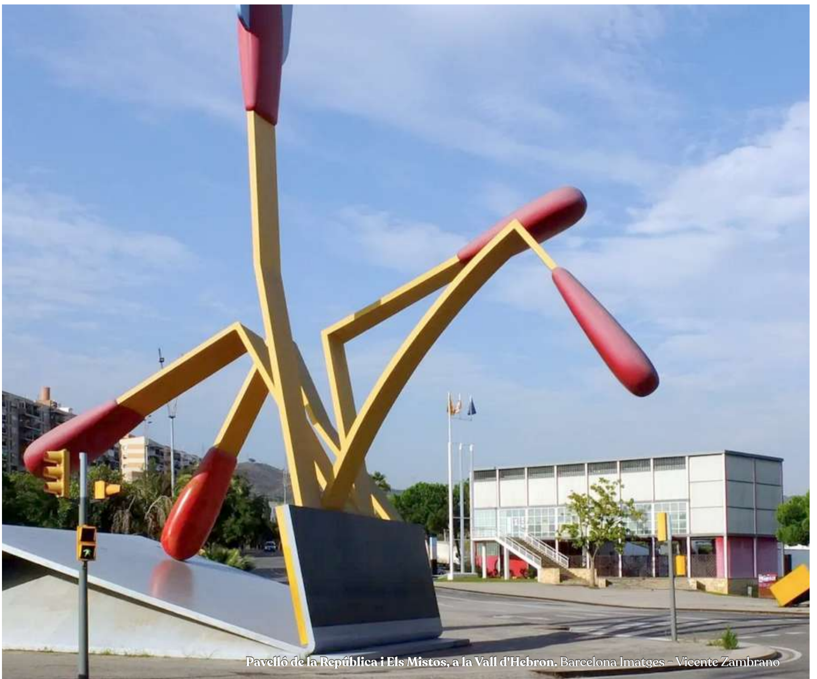
Pavelló de la República i Els Mistos, a la Vall d'Hebron, Barcelona