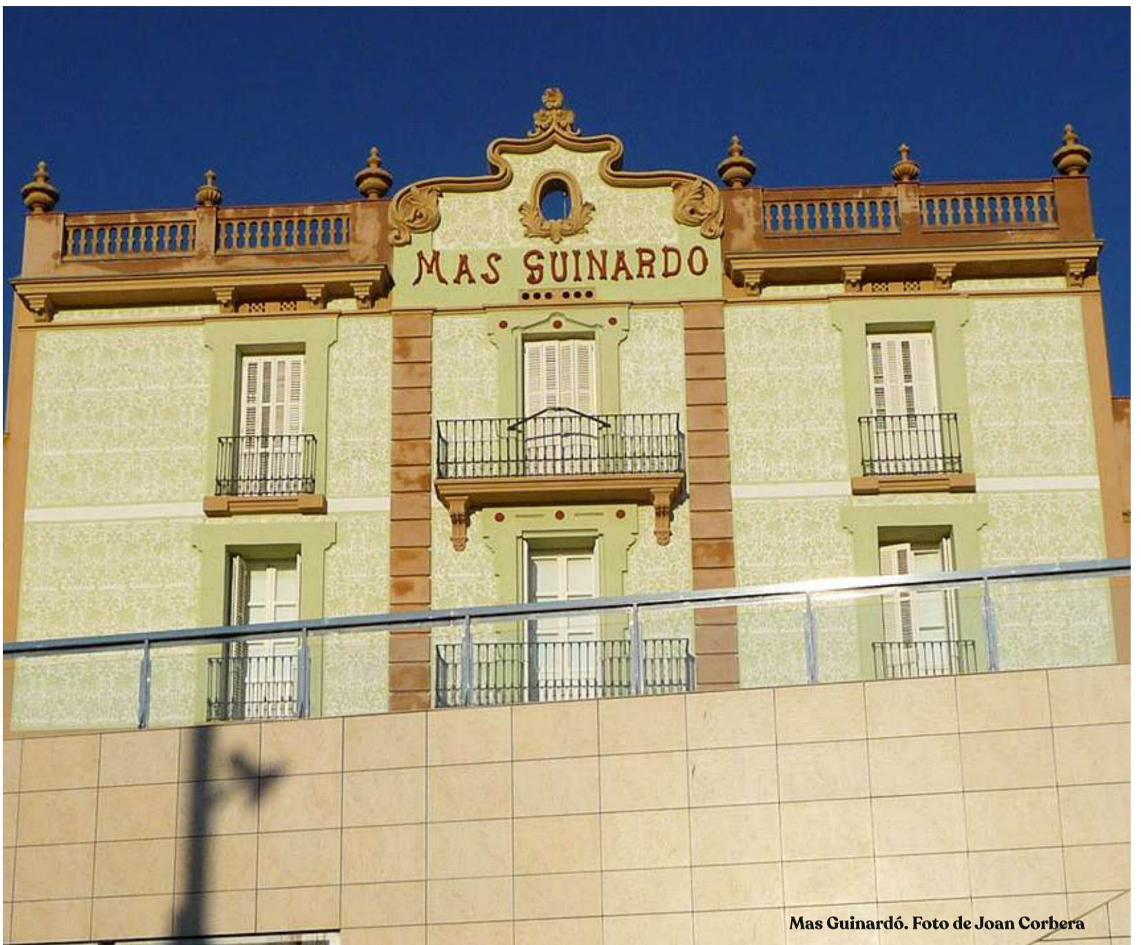
Mas Guinardó.