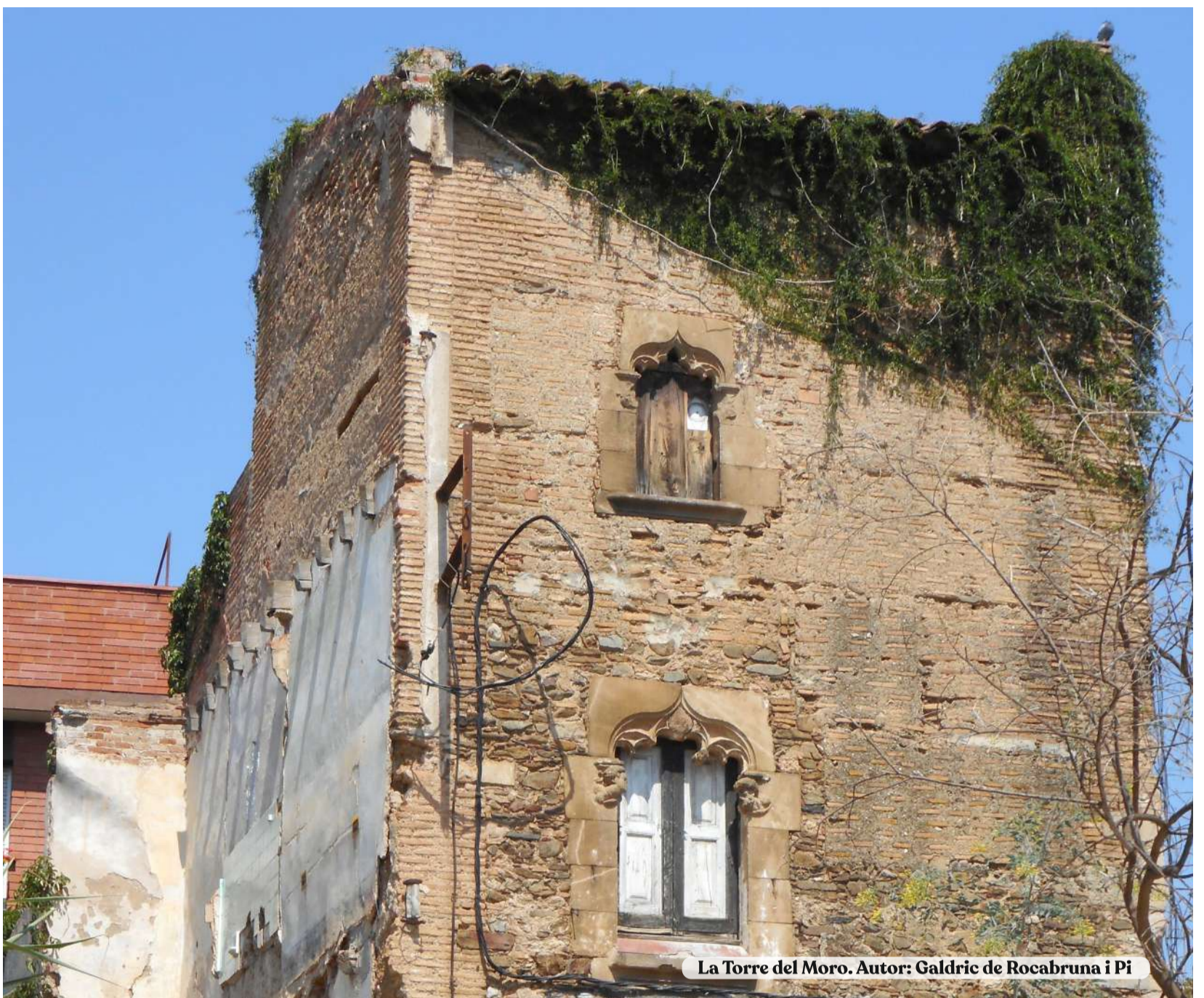
La Torre del Moro. Autor: Galdric de Rocabruna i Pi