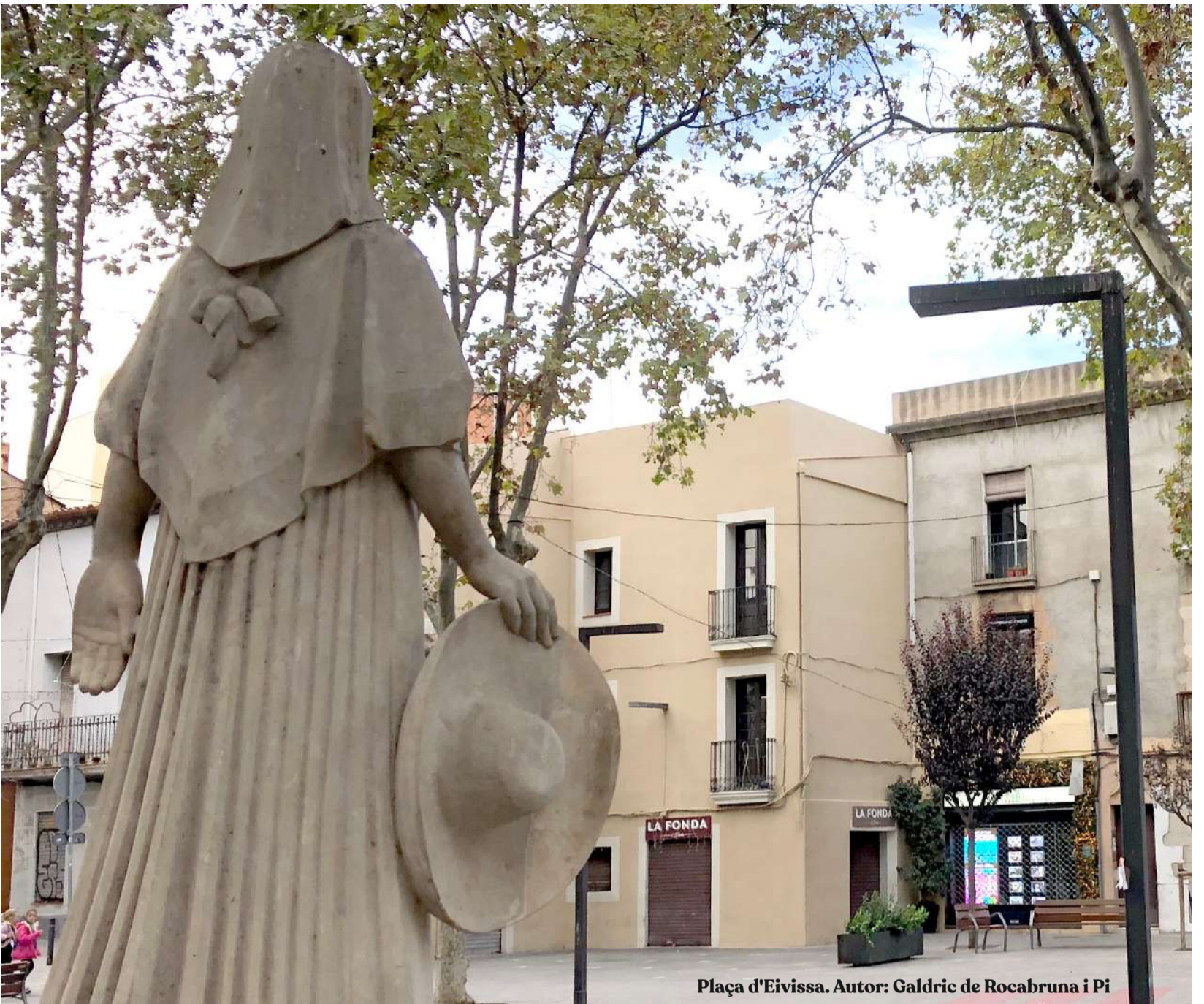
Plaça d'Eivissa. Autor: Galdric de Rocabruna i Pi