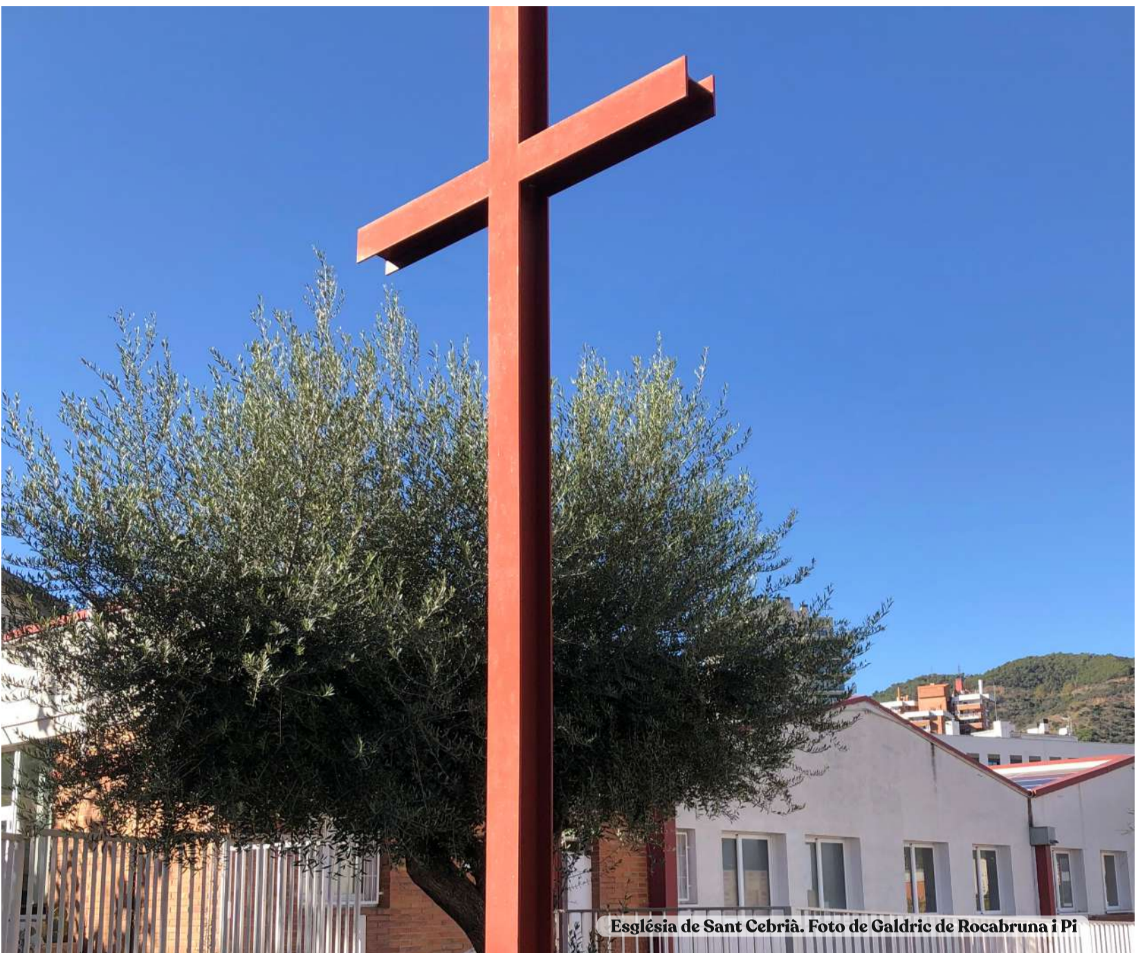
Església de Sant Cebrià.